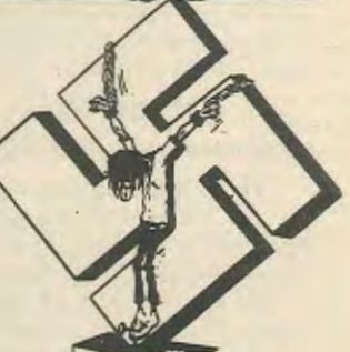
Λους μέσα σε λίγο χρόνο.

Πιο πέρα, βρίσκεται το κοιμητήριο των Ναζι, αυτών που σκοτώθηκαν απο το βάρος των δικών τους ανομημάτων. Πόσες χιλιάδες αθώνων θυμάτων αναλογουν άραγε στον καθένα; Κι' όμως το κοιμητήριο είναι ντυμένο στα γιορτινα του, έτοιμο να υποδεχτει τον πρόεδρο των Η.Π.Α. κ. Ρήγκαν. Πρόκειται να τους καταθέσει στεφάνι για τα κατορθώματα τους, που σκότωσαν τόσους πολ-